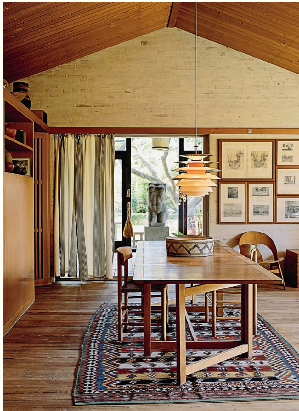
Fig. 182 Interiør i parcelhus fra 1958, tegnet, møbleret og beboet af Børge Mogensen.