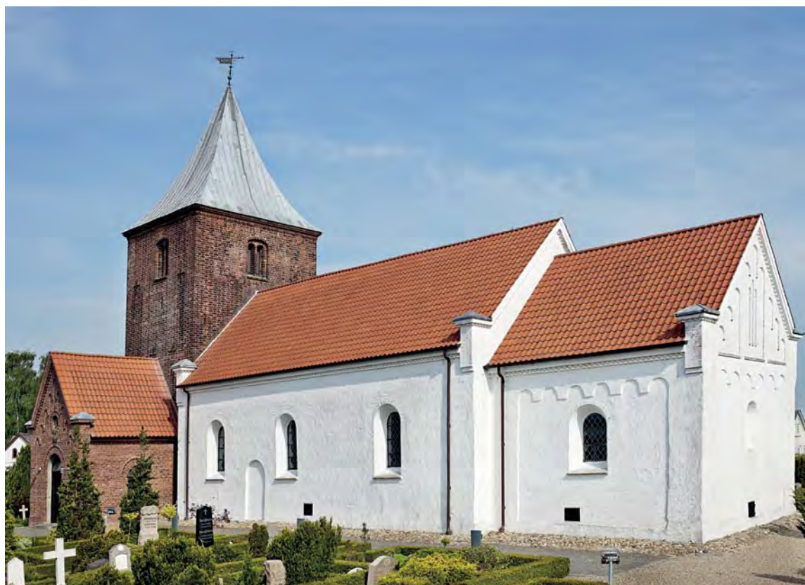
Fig. 4. Kirken set fra sydøst. – The church seen from the south east.

Efter landmilitens nedlæggelse skulle en †træ- hest 1765 sælges på auktion ved herredsfogedens foranstaltning (jf. †geværskab s. 1673). 10 Det mi- litære strafferedskab har formodentlig været op- stillet nord for kirkegården, hvor bondesoldater- ne havde deres eksercerplads. 11