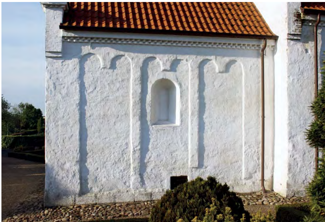
Fig. 6. Korets nordside med blændingsdekoration (s. 1658). – North side of the chancel with recess decorations.

cm (indvendig) og har bund ca. 220 cm over nuværende terræn. Ved genåbningen 1909 var de smigede indersider endnu intakte, pudset og smykket med romanske kalkmalerier (fig. 10 og 11). Skibets vinduer er ca. 150 cm høje og anbragt højt med bund næsten 3 m over terræn.