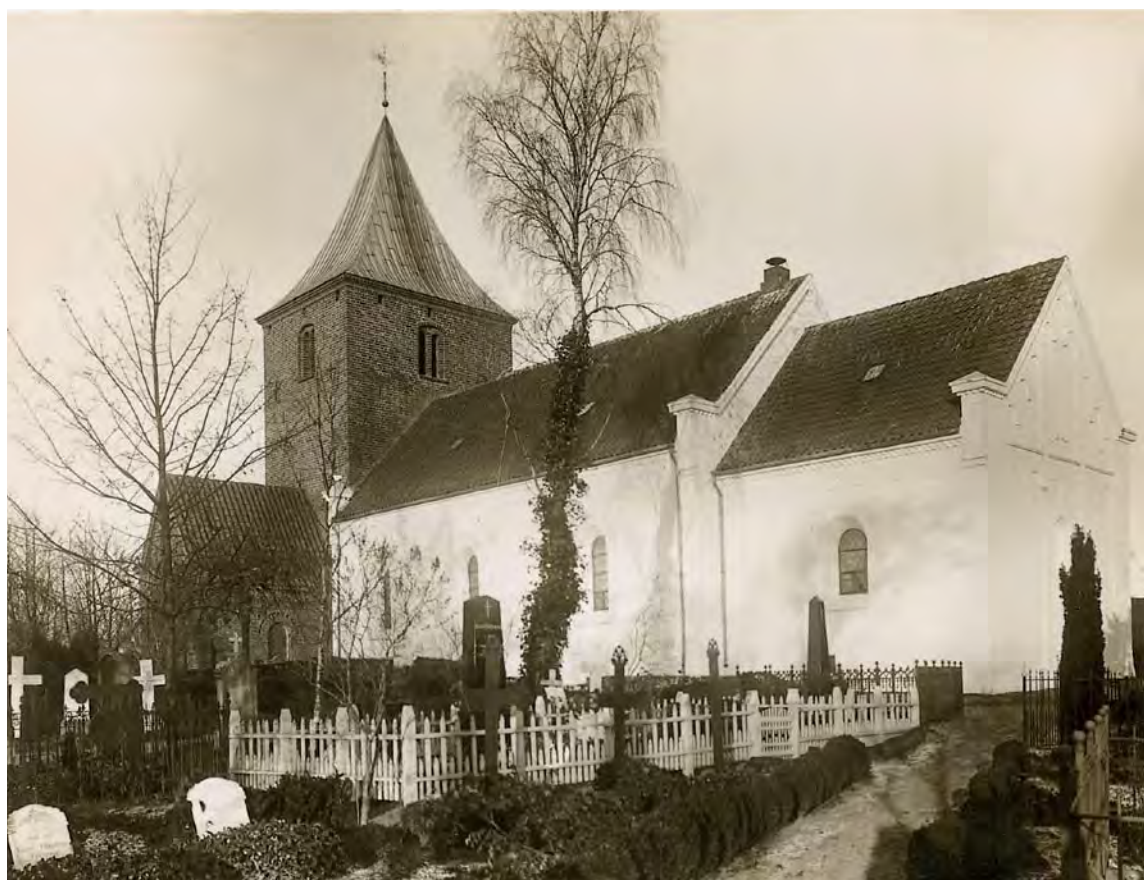
Fig. 8. Kirken, set fra sydøst, efter udskiftning af vinduer 1909 (s. 1662). Foto o. 1920 i Stenderup Sogns Lokalkiv. – The church, seen from the south east, after the replacement of windows in 1909.

Ifølge de sporadisk bevarede regnskaber var tårnet 1680 'ganske revnet og skilt ad', og tømmeret måtte repareres med tre store egebjælker,