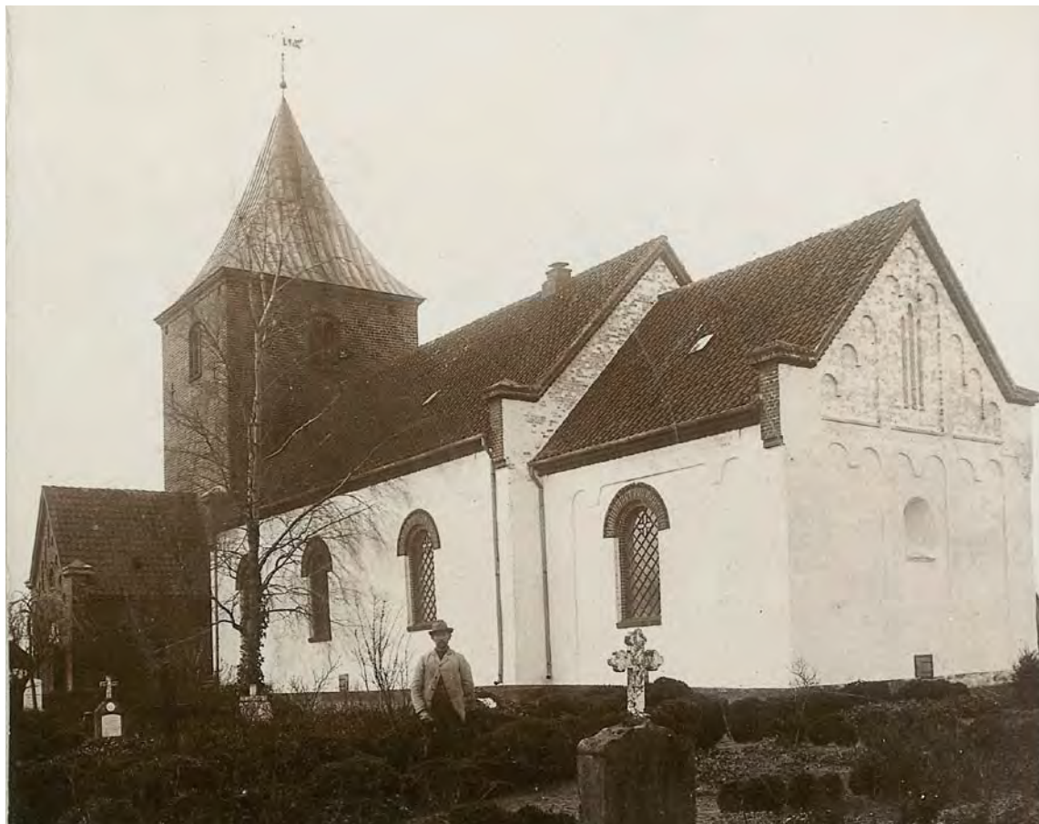
Fig. 7. Kirken set fra sydøst i tiden 1865-1909 (s. 1662). – The church seen from the south east in the period 1865-1909.

forholdsvis tidligt (1300-tallet?), idet det romanske kalkmaleri ikke var overkalket, inden vinduet blev tilmuret i flugt med væggen (jf. s. 1664). 12