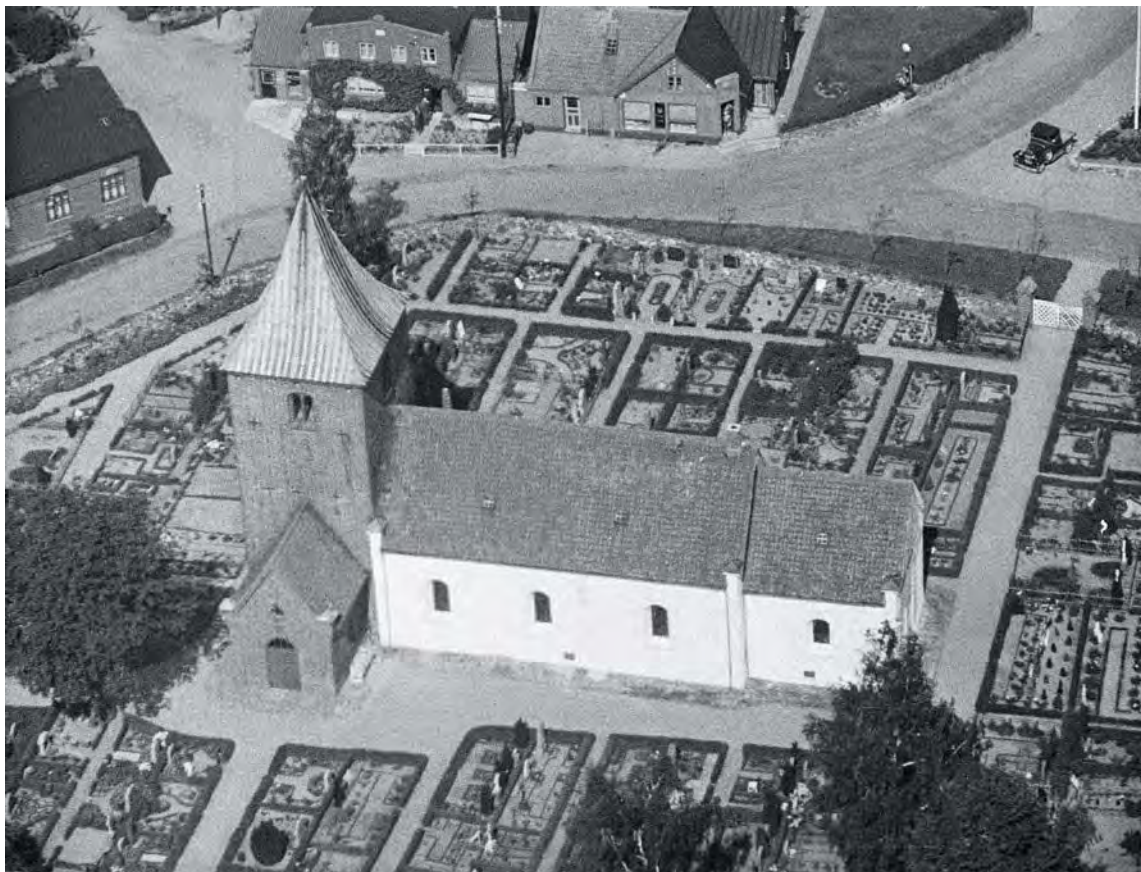
Fig. 2. Luftfoto af kirken set fra sydøst. Ålborg Luftfoto o. 1951. KglBibl. – Aerial photo of the church seen from the south east.