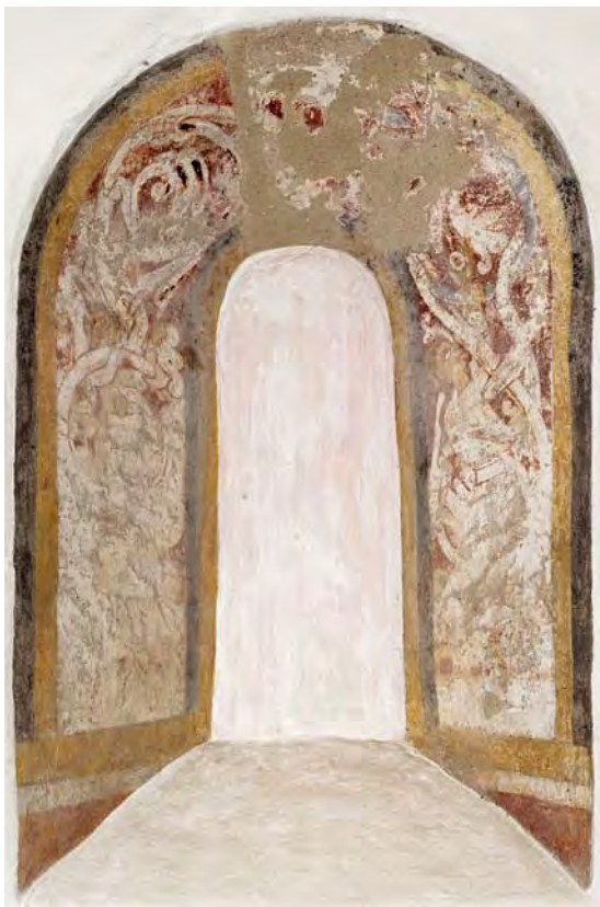
Fig. 10. Kalkmaleri med beboet ranke i korets nordvindue, o. 1150-75 (s. 1664). – Wall painting with inhabited scroll in the north window of the chancel, c. 1150-75.