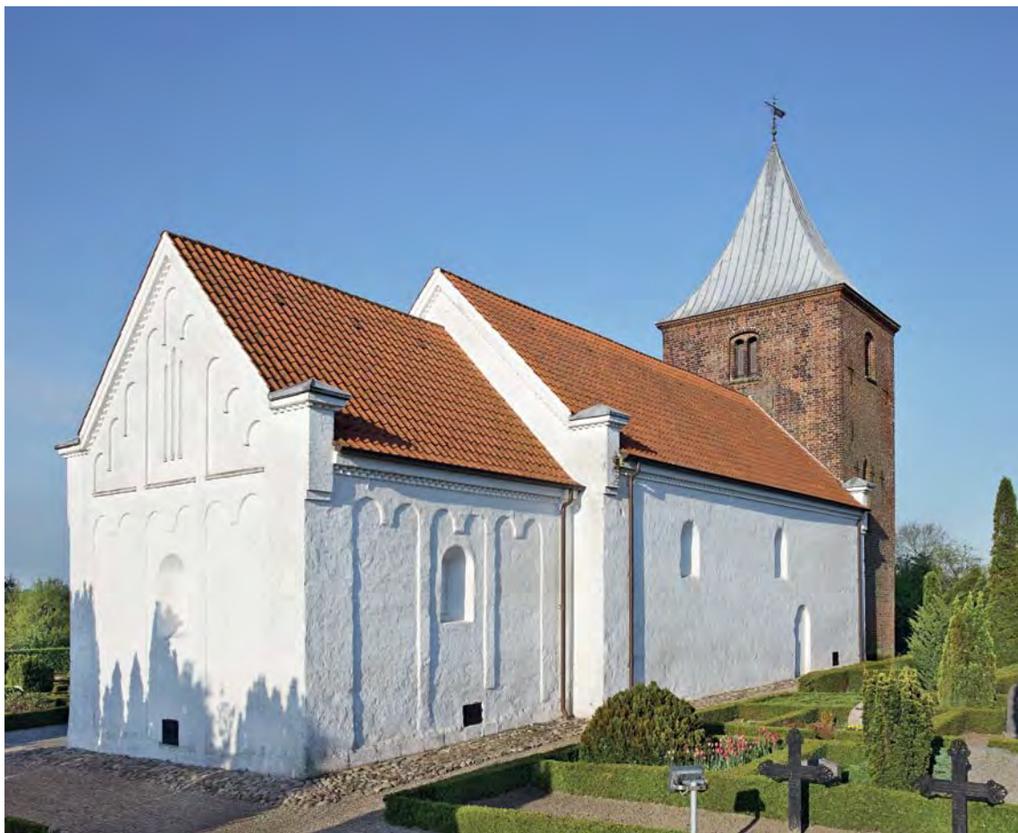
Fig. 1. Kirken set fra nordøst. – The church seen from the north east.