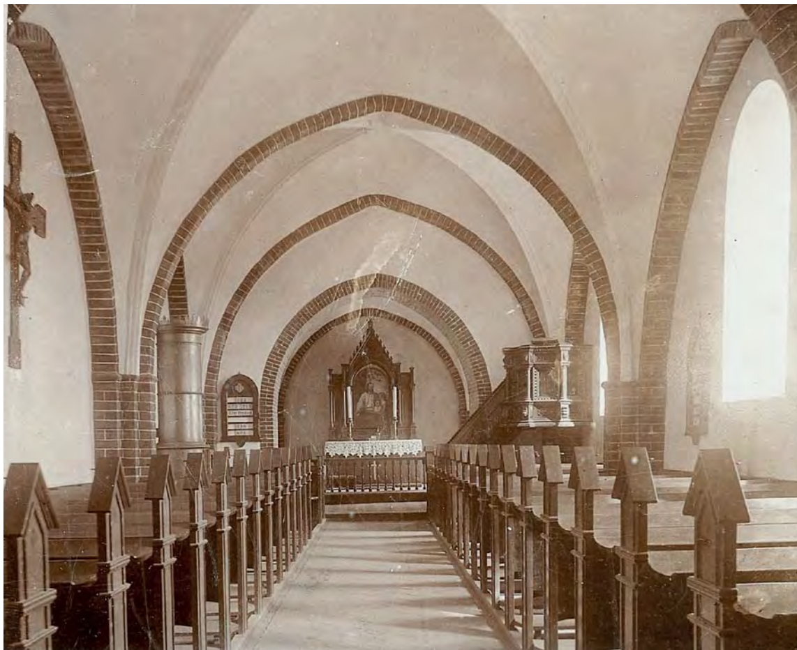
Fig. 9. Indre set mod øst i tiden 1865–1909 (s. 1662). Foto o. 1905 i Stenderup Sogns Lokalarkiv. – Interior seen towards the east in the period 1865–1909.

også hvælpillerne, hvorved kirkerummet fik den fremtræden, det har i dag. Udvendig er alt hvidt med undtagelse af tårn og våbenhus, der er i blank mur.