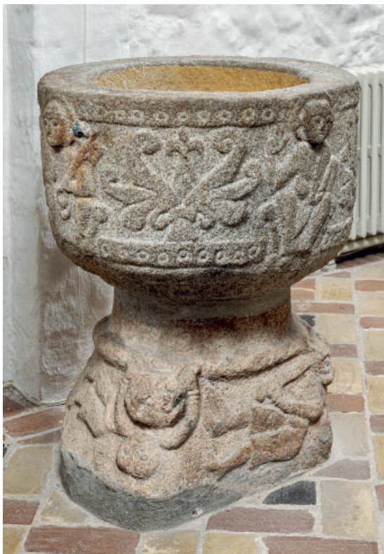
Fig. 42. Døbefont, romansk (s. 4314). – Font, Romanesque.