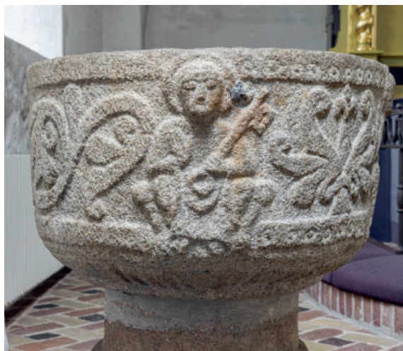
Fig. 46–48. Detaljer på kummen af den romanske døbefont (s. 4314). 46. Sydside. 47. Østside. 48. Vestside. – Details of the basin of Romanesque font. 46. South side. 47. East side. 48. West side.

sig ‘meget smukt’; samtidig blev den flyttet ud fra væggen. 24