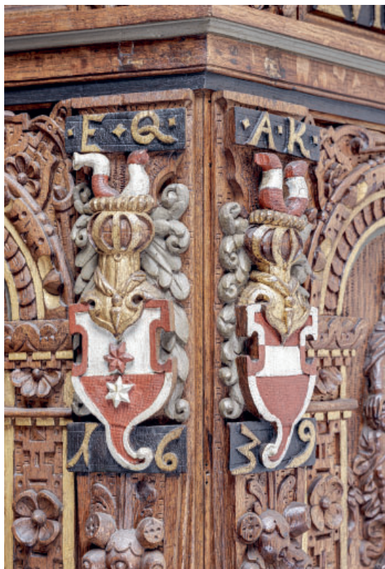
Fig. 53. Våbenskjolde og initialer for Erik Qvitzow og Anne Krabbe samt årstallet »1639«. Detalje af prædikestol (s. 4318). Foto Arnold Mikkelsen 2024. – Coats of arms and initials of Erik Qvitzow and Anne Krabbe with the date »1639«. Detail of pulpit.

En †korskranke (jf. fig. 30) fra slutningen af 1800-tallet, af træ, var opsat midt i andet fag med indgang til koret midt for, flankeret af en kraftig, kanneleret søjle kronet af en vase. Skranken blev nedtaget 1943.