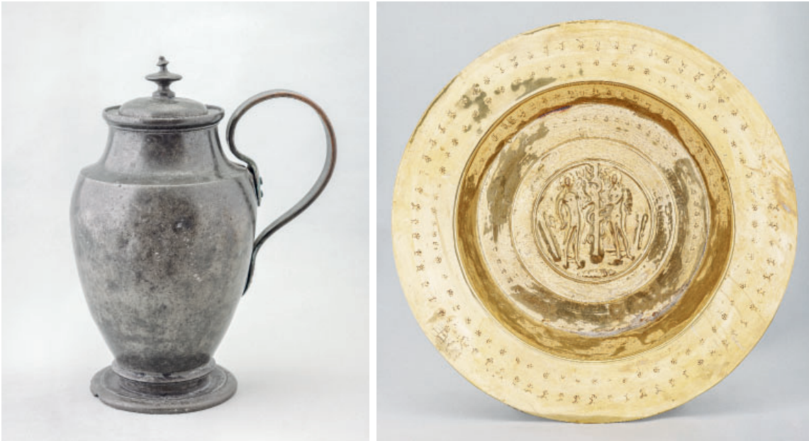
Fig. 49-50. 49. Dåbskande, o. 1850-70 (s. 4317). 50. Dåbsfad, 1500-tallet (s. 4316). – 49. Baptismal jug, c. 1850-70. 50. Baptismal dish, 1500s.

101). 153 Modstående er et graveret monogram for et senere ejerpar bestående af et sammenskrevet »TS« omgivet af bogstaverne »KPD« (fig. 52 og 101). 154 Under bunden er flere reparationer med tin.