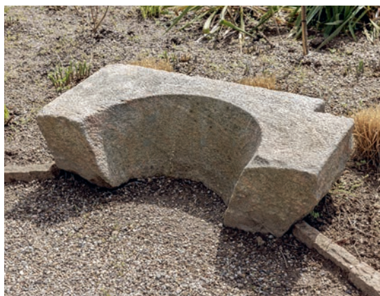
Fig. 12. Vinduesoverligger opstillet på kirkegården (s. 4014). – Window lintel placed in the churchyard.

ændring af bygningen. Vestforlængelsen er opført af kvadre på en skråkantsokkel med genanvendte hjørnekvadere. Overgangen mellem den og skibet står tydeligst frem på nordsiden; her markeret ved en kraftig lodfuge over norddøren tillige med en ændring af skiftegangen i kvadrene på vestsiden (jf. fig. 8).