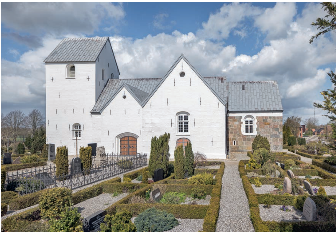
Fig. 7. Kirken set fra syd. Foto Arnold Mikkelsen 2023. – The church seen from the south.