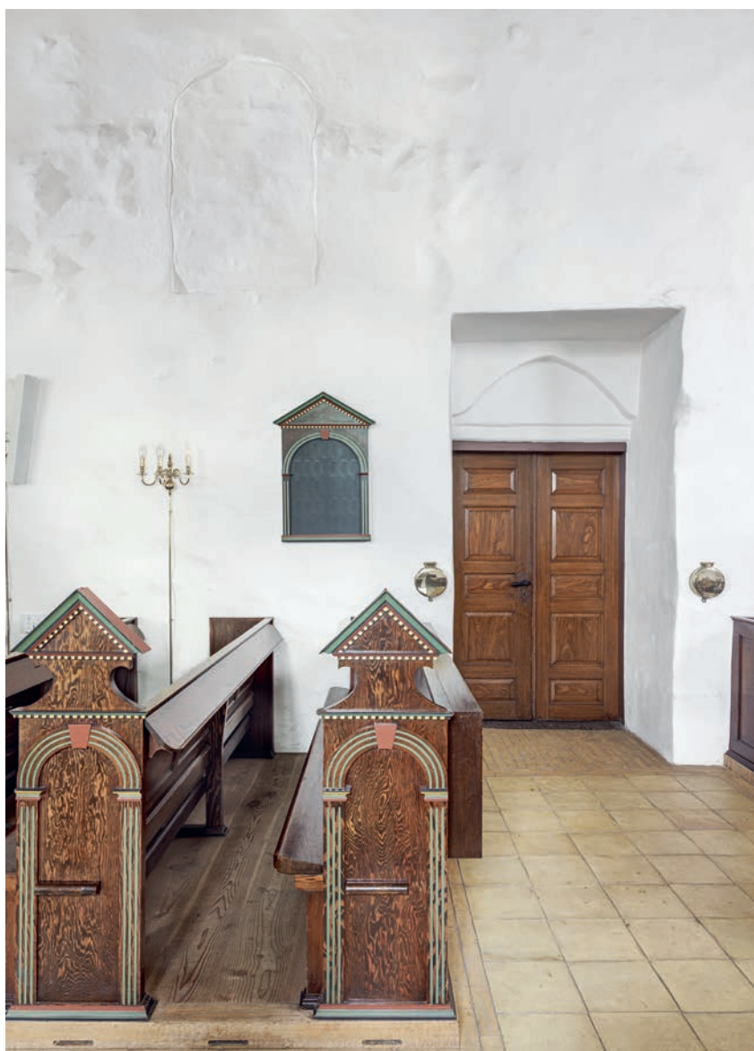
Fig. 9. †Vindue (s. 4014) og dør (s. 4013) i skibets sydside. Foto Arnold Mikkelsen 2023. – †Window and door in the south side of the nave.

Indre. Kun enkelte detaljer er bevaret. Skibet dækkes fortsat af flade bjælkelofter, der gennem tiden er omgjort flere gange (jf. s. 4023).