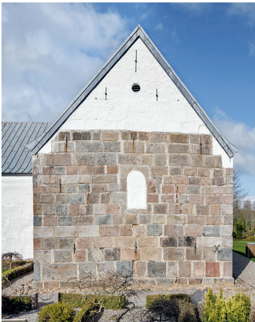
Fig. 13. Koret set fra øst med †vindue (s. 4014). – The chancel seen from the east with †window.

Tårnrummet, der fra syd oplyses af en måske oprindelig, om end flere gange omgjort åbning nu med kurvehanksformet stik (fig. 17, s. 4025), forbindes med skibet ved en bred spidsbuet arkade (jf. fig. 100). Vestligst i nordvæggen er en fladbuet