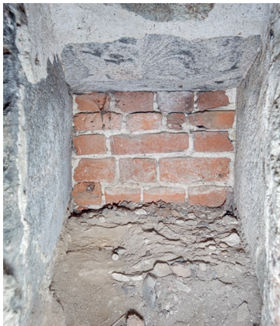
Fig. 15. Hagioskopets indvendige kvadersatte karme og loff. Lukket med munkesten (s. 4014). Foto Arnold Mikkelsen 2023. – The interior ashlar frame of the hagioscope. Bricked up with medieval brick.

Om en udvidelse af korbuen skete samtidig med hvælvslagningen, er uklart, men forekommer sandsynlig. I hvert fald er det muligt, at de kon-