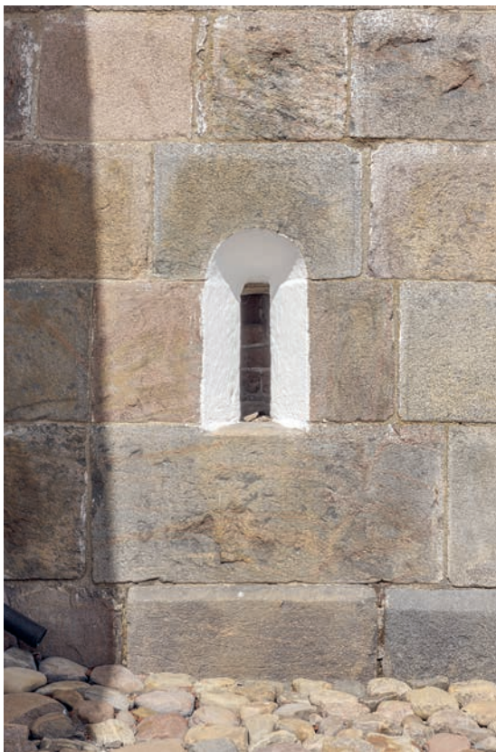
Fig. 14. Hagioskop i korets sydmur (s. 4014). – Hagioscope in the south wall of the chancel.

niche, hvis alder ikke lader sig nøjere bestemme (fig. 18). Rummet dækkes af et krydshvælv med spids skjoldbue mod vest og retkantede halvstensribber, der udgår fra murede forlæg i væggene.