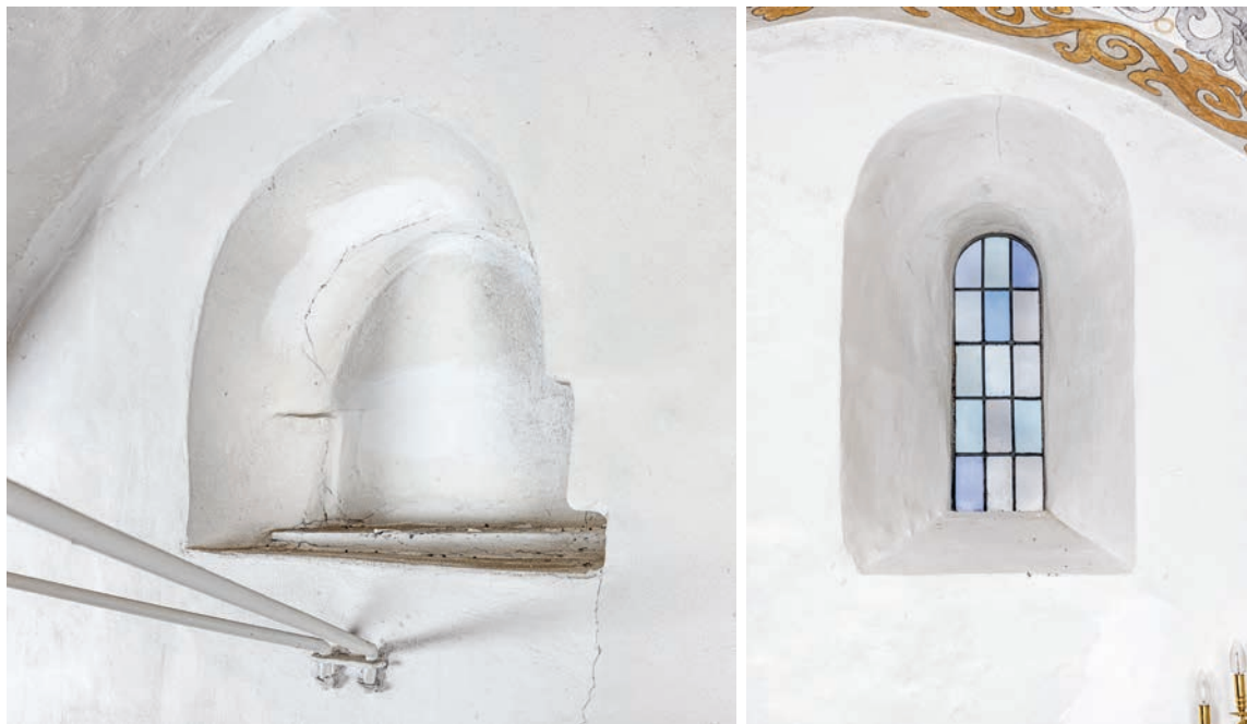
Fig. 10-11. 10. †Vindue i korets øst gavl (s. 4013). 11. Oprindeligt vindue i korets nordside (s. 4013). – 10. †Window in the eastern gable wall of the chancel. 11. Original window in the north side of the chancel.

Kor og skib adskilles af en triumfmur med rundbuet korbu (fig. 47), der er udvidet og omsat ad flere omgange i henholdsvis senmiddelalderen og i nyere tid (jf. s. 4018 og 4024). Vangernes materiale, der er gemt bag et tykt lag puds, lader sig ikke bestemme, 46 men de har granitsokler med attisk profil. Buens vederlag markeres mod nord af en karnisprofileret kragsten i granit, mens den søndre udgøres af et nyere, støbt kragbånd (s. 4024). 47