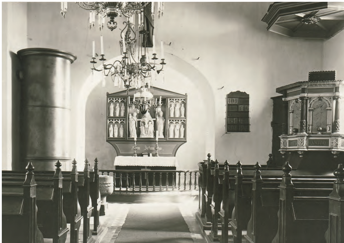
Fig. 27. Kirkens indre set mod øst. Foto før 1918. I NM. – The interior of the church looking east.