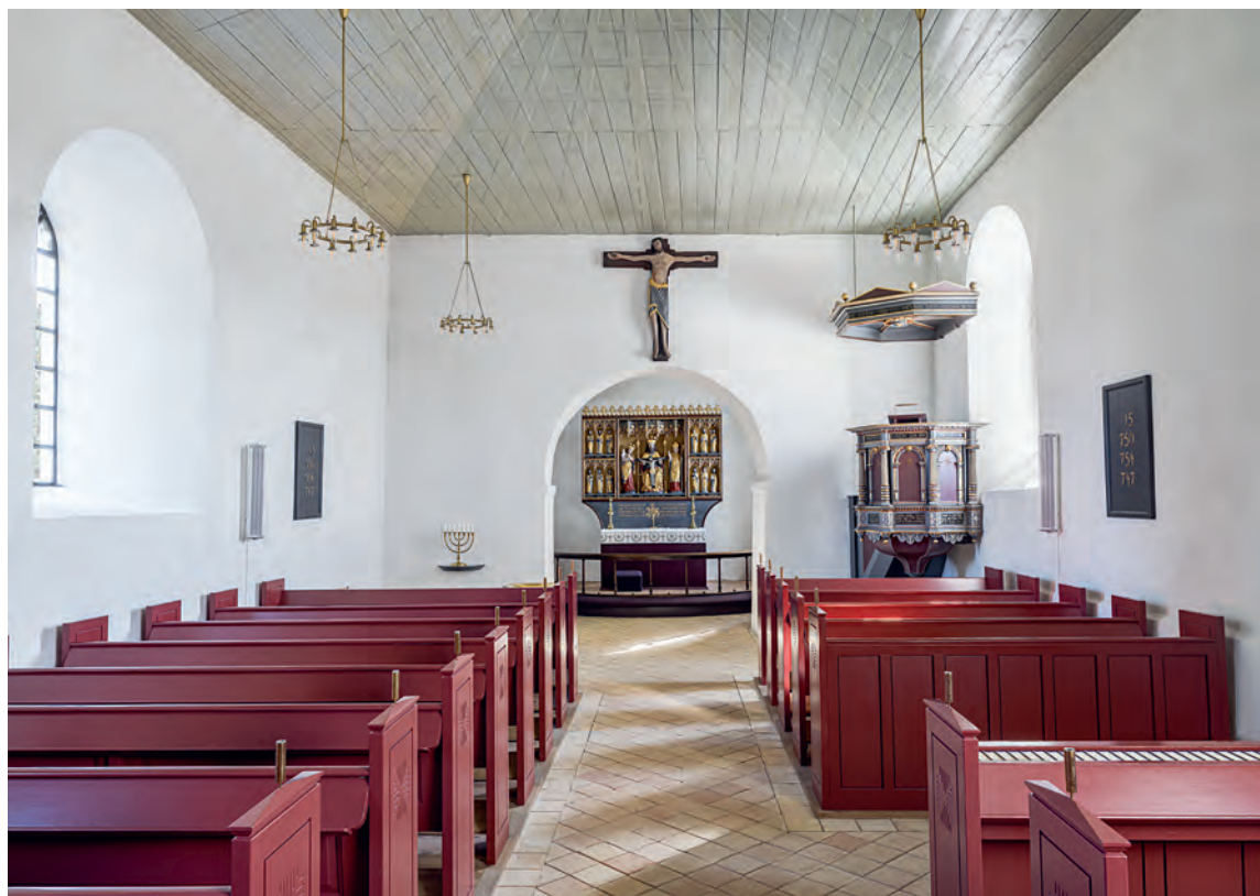
Fig. 28. Kirkens indre set mod øst. – The interior of the church looking east.

loftsmalerierne blev udført og inventaret malet i den samme grå/blå farveholdning som loftet. Denne første store, gennemgående reovering af farveholdningen er tilsyneladende først sket 1931, hvor inventaret fik mørke brune og blå toner. 21