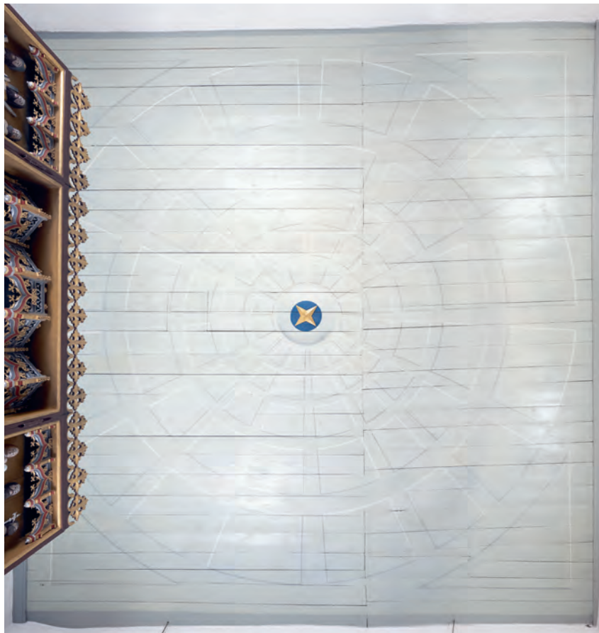
Fig. 25. Korets loftsudsmykning, 1700-tallets sidste del (s. 3387). – The decoration of the ceiling in the chancel, late 18th century.

tømmer viser fældningsårene 1650/51, o. 1677 og 1695-98. Disse daterer nok diverse udskiftninger og reparationer, hvilket også må være tolkningen af en sidste og mindste gruppe tømmer, der viser fældningsårene hhv. 1854 og 1879.