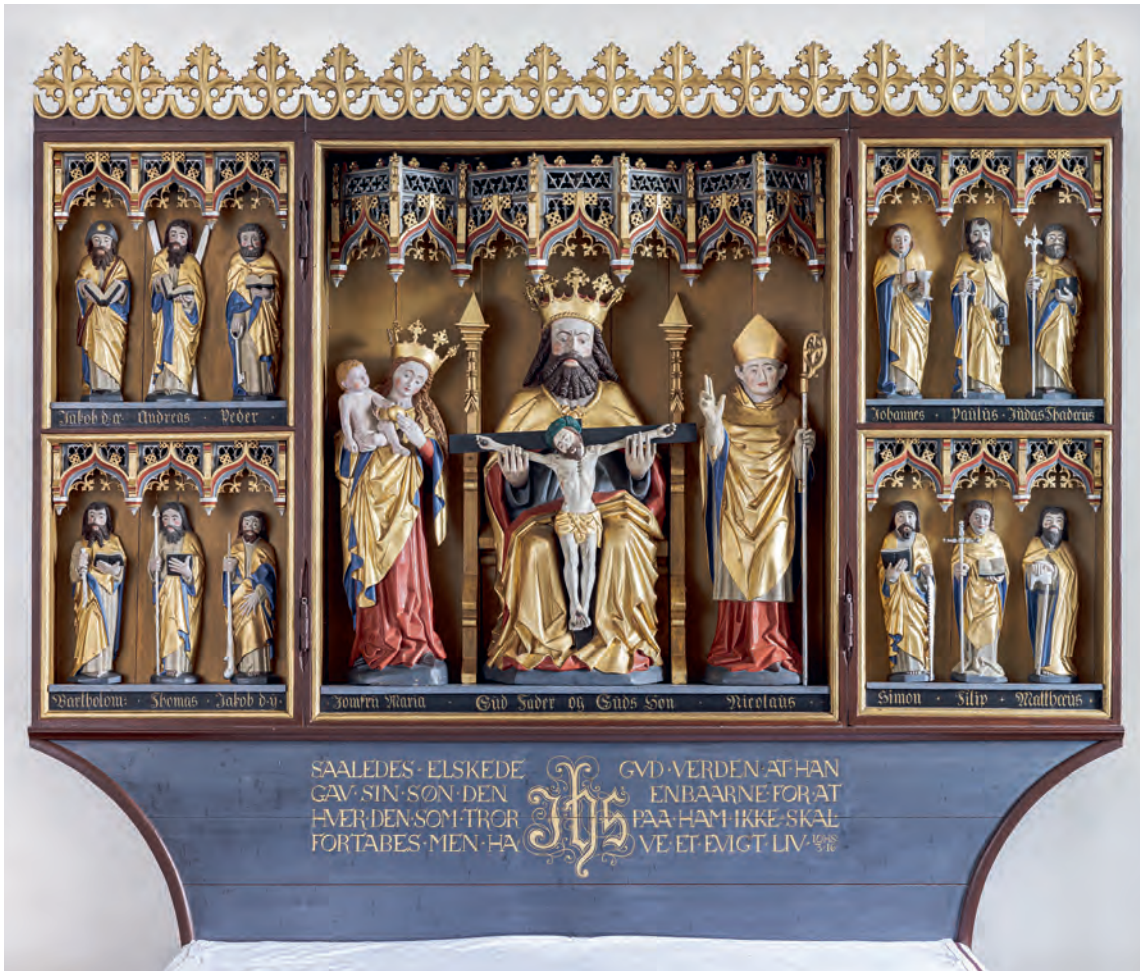
Fig. 29. Senmiddelalderlig altertavle, o. 1475–1500 (s. 3390). – Late medieval altarpiece, c. 1475–1500.

den Ældre med ibsskallen på den ombøjede hat og en åben bog i hånden. Han følges af Andreas med dennes kors antydnet bag ham. Andreas står også med en åben bog. Dernæst ses Peter, der har en ganske stor nøgle i den ene hånd (fra 1931) og en mindre opslået bog i den anden. I den nedre række ses fra venstre: Bartolomæus med en kniv (fra 1931) og en åben bog. Derefter kommer Thomas med et spyd (fra 1931) i den ene hånd, den anden holder en bog. Denne følges af Jacob den Yngre, som griber om en stor kølle.