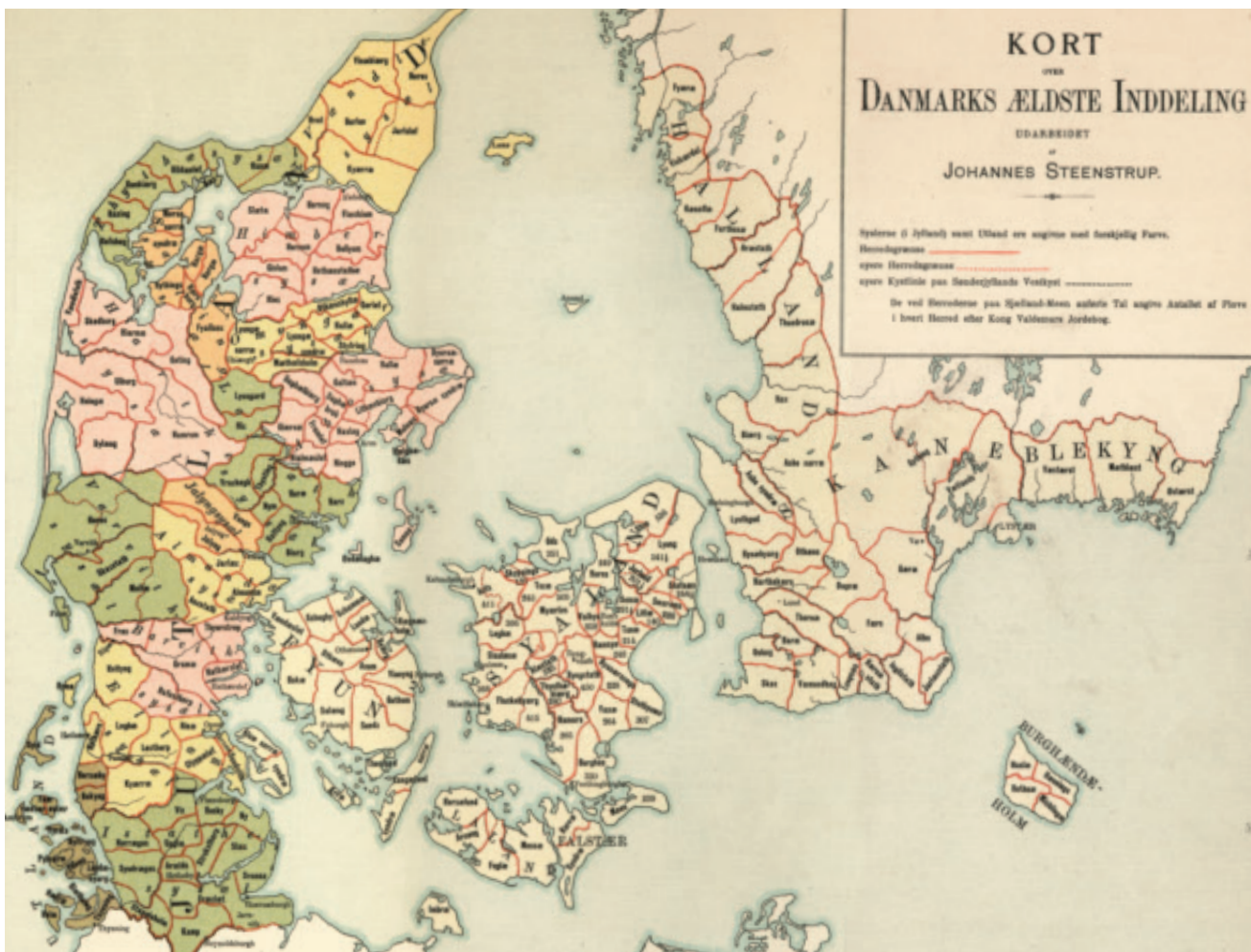
Figur 2. Kortet viser det mid-delalderlige Danmarks udstrækning samt Fehmarn, der ikke behandles i denne afhandling. De administrative inddelinger ses også, dog med enkelte fejl, sammenlign med Figur 161 (se noten ved figurhenvisningen i hovedteksten).

Tidsmæssigt er den primære undersøgelse begrænset til den traditionelle danske middelalder, perioden fra 1050-1536. Her er vi i en periode, hvor stort set hele landet er kristent, og hvor kirken er en fast forankret del af den romerskkatolske kirke. 12 Konsekvensen af det er, at det stort set er udviklingen og forandringerne internt i den samme kirke og det samme samfund, der undersøges.