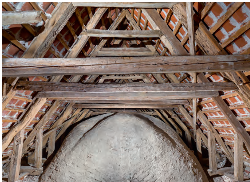
Fig. 14. Skibets hvælv (s. 5178) og tagværk (s. 5182) set mod vest. – The nave's vault and roof structure looking west.

Loft. Korets flade, gipsede loft er senest udskiftet 1984 ved arkitekt Ebbe Lehn Petersen, Odense. 28