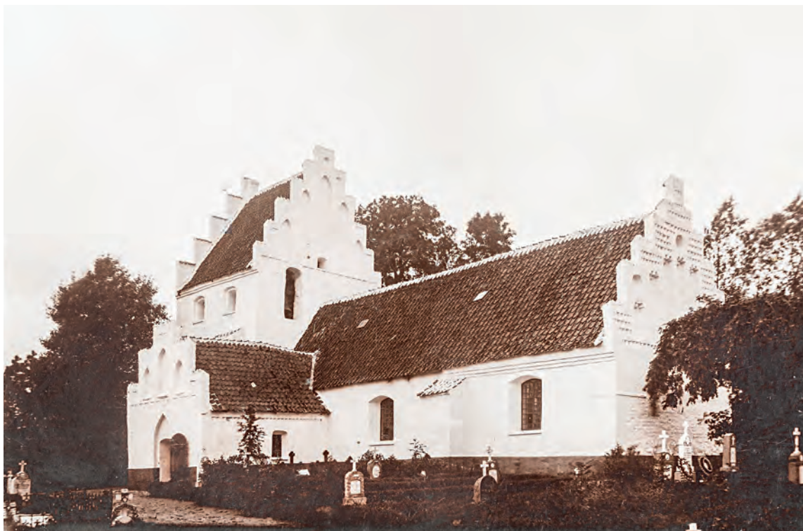
Fig. 15. Kirken set fra sydøst før istandsættelsen 1913-14. Foto i kirken. – The church seen from the south east before its restoration in 1913-14.

† Støttestøtter. 1674 omtales to støttestøtter 'mod gangen til klokken'. Den ene må være trappehuset, mens den anden kan være en støttestøtte på trappehusets sydside (jf. s. 5178). 23 En pille her omtales igen 1689 i forbindelse med en reparation. 23