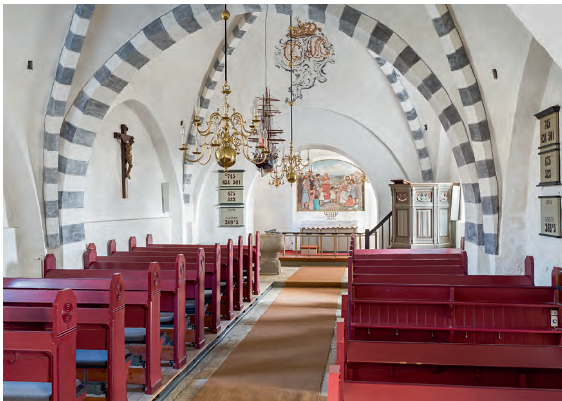
Fig. 24. Kirkens indre set mod øst. – The interior of the church looking east.