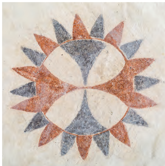
Fig. 19. Viekors, kalkmaleri fra o. 1480-90 ved 'Brylløværkstedet', i tårnhvælvets nordkappe (s. 5184). – Consecration cross, mural from c. 1480-90 of 'the Brylle workshop', in the north severity of the tower vault.

ribberne (med kors i ribbekrydset) foruden grove masker omkring alle spygatter (fig. 16-18). 54 Passerroetterne har alle udgangspunkt i et cirkelkors, men er forskelligt udformede. Østkappens udfyldes af småcirkler og kantes af korsbærende trekanter. Sydkappens indskrives af to cirkelslag med tovsnoning og en bort af halvcirkler. Nordkappens har et enkelt cirkelslag kantede af spidsblade (fig. 19). Vestkappens roset er atter overkalket, da den var beskadiget af en \ddagger skorsten (s. 5183). Den havde hvide korsblade mellem skiftevis grå og rød bund og kantedes af cirkler og romber. 55