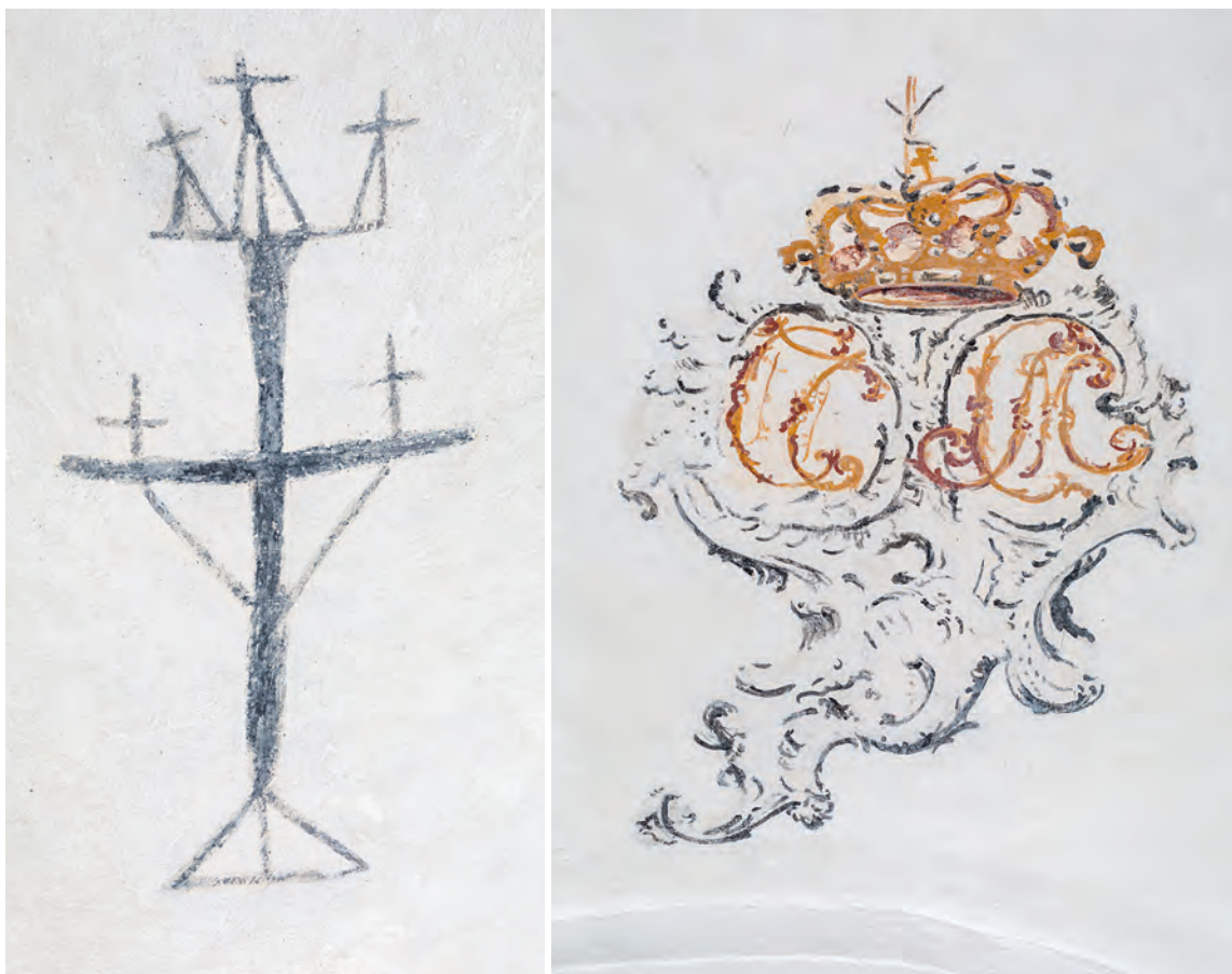
Fig. 20–21. 20. Kalkmalet kors, o. 1450–1500, i østkappen af skibets vestfag (s. 5184). 21. Christian VII's og Caroline Mathildes kronede monogrammer, kalkmaleri fra o. 1768 i skibets østfags østkappe (s. 5185, jf. fig. 24). – 20. Mural cross, c. 1450–1500, in the east severy of the western bay of the nave. 21. Christian VII's and Caroline Mathilde's crown monograms, mural from c. 1768 in the east severy of the east bay of the nave (cf. fig. 24).

Eftermiddelalderligt kalkmaleri. En stor rokokokar-touche i østkappen af skibets østfag viser Christian VII's og Caroline Mathildes kronede monogrammer (fig. 21). Maleriet er udført med sort, okkergult og rødt, formodentlig ved en istandsættelse 1768 (jf. s. 5187). I nord- og sydkappen blev der konstateret lignende dekorationer, som ikke blev fremdraget. 55