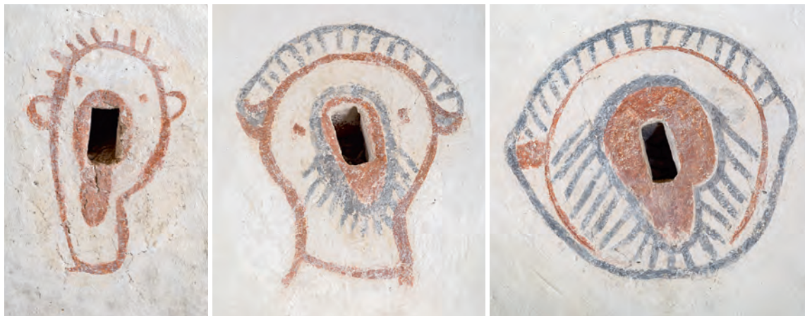
Fig. 16-18. Masker omkring tårnhvælvets spygatter, kalkmaleri fra o. 1480-90 ved 'Brylløværkstedet' (s. 5184). – Faces surrounding the scuppers in the tower vault, mural from c. 1480-90 of 'the Brylle workshop' .