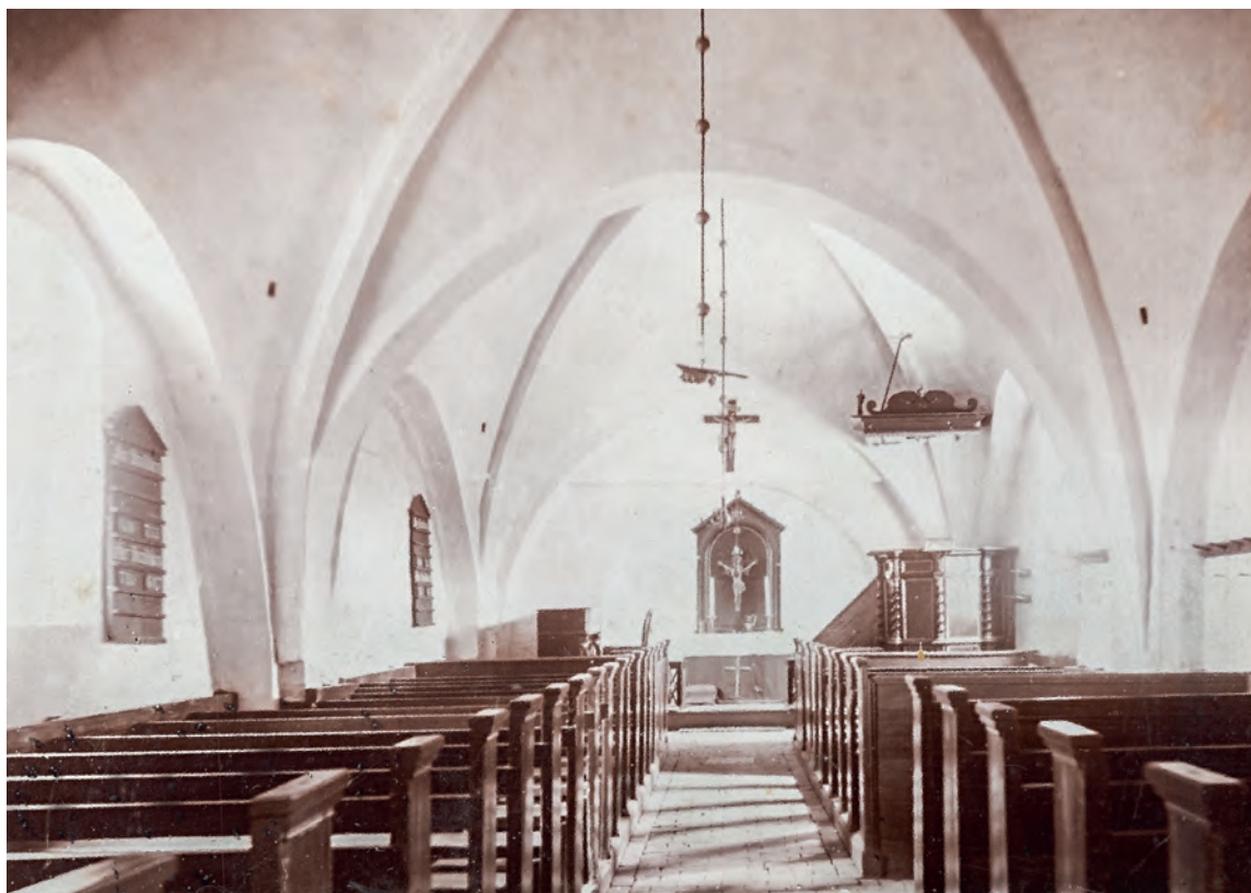
Fig. 23. Kirkens indre set mod øst før istandsættelsen 1913-14. – The church interior looking east before its restoration in 1913-14.