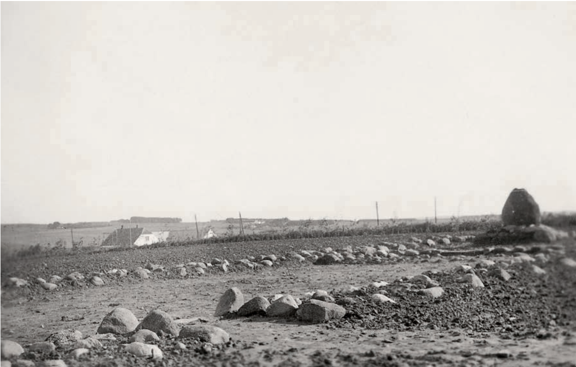
Fig. 4. Midt i koret en mindesten med indskriften »1321 Her laa Sæthorp Kirke«, mens tomten er markeret med kampesten. Set fra sydvest. Foto Kjær, 1931. – In the middle of the chancel, a memorial stone with the inscription '1321 Here lay Sæthorp Church' while the site is marked by fieldstones. Seen from the south west.