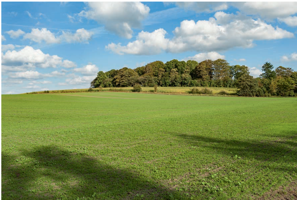
Fig. 1. Kirken lå på en bakketop, der gemmer sig i skovtykningen. Set fra sydvest. Foto Arnold Mikkelsen 2016. – The church was on a hilltop hidden in the forest. Seen from the south west.