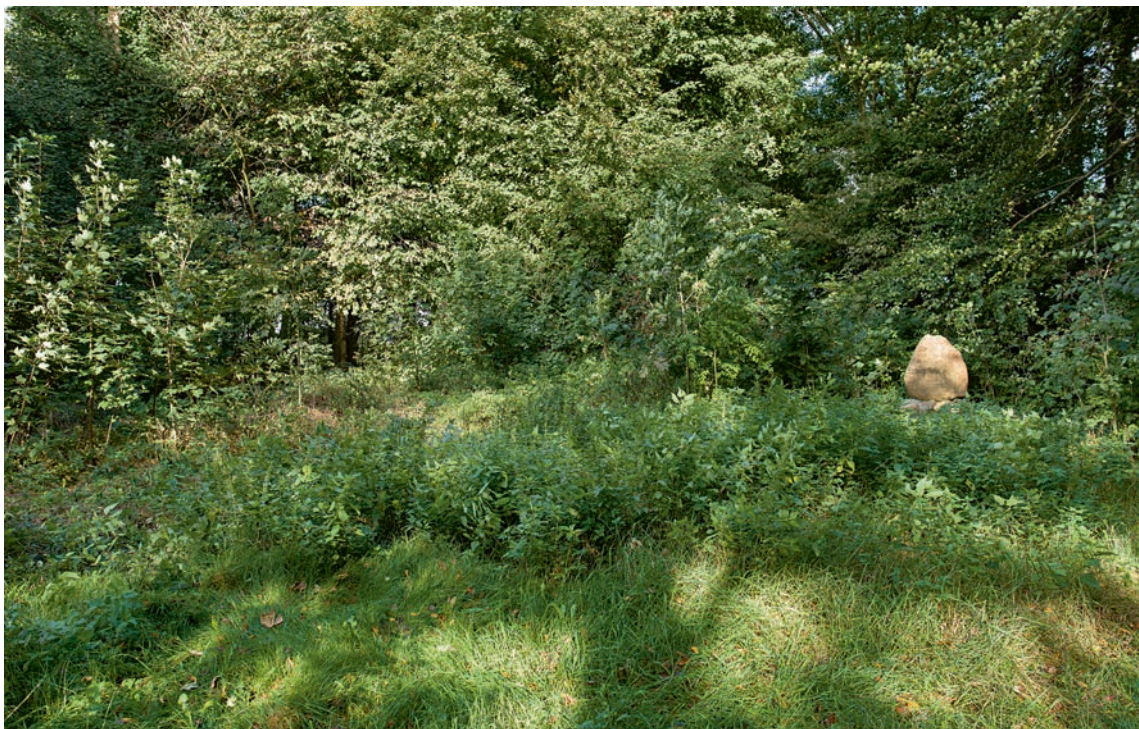
Fig. 2. Anlægget omkring kirketomten er groet til. Set fra sydvest. – The grounds around the church site are overgrown. Seen from the south west.