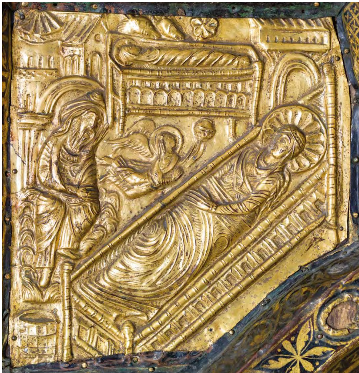
Fig. 28. Jesu Fødsel (relief nr. 6), udsnit af *gyldent alter fra o. 1175-1200 (s. 2144). – The Nativity (relief no. 6), detail of *golden altar from c. 1175-1200.

der er delvis perspektiviske. Til venstre sidder Josef foran en arkade og holder som vanligt hånden under kind, mens en svævende engel midt i billedet svinger et røgelseskar.