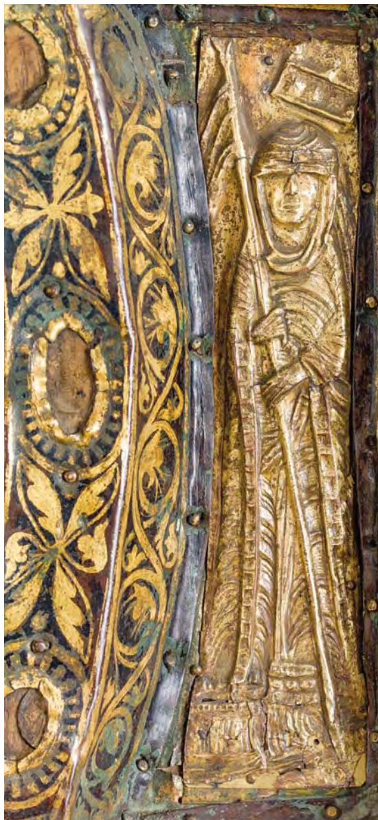
Fig. 27. Synagoga (relief nr. 3), en personifikation af den besejrede jødedom, udsnit af *gyldent alter fra o. 1175-1200 (s. 2144). – Synagoga (relief no. 3), a personification of defeated Judaism, detail of *golden altar from c. 1175-1200.

omgives af en tynd perlestav, er vist siddende på en trone med højre hånd hævet velsignende og den venstre holdende Livets Bog imod knæet; de bare fødder er sat på en skrånende fodskammel. Det store, brede hoved omgives af en lidt klemt korsglorie med kransende perlestav. Det tynde