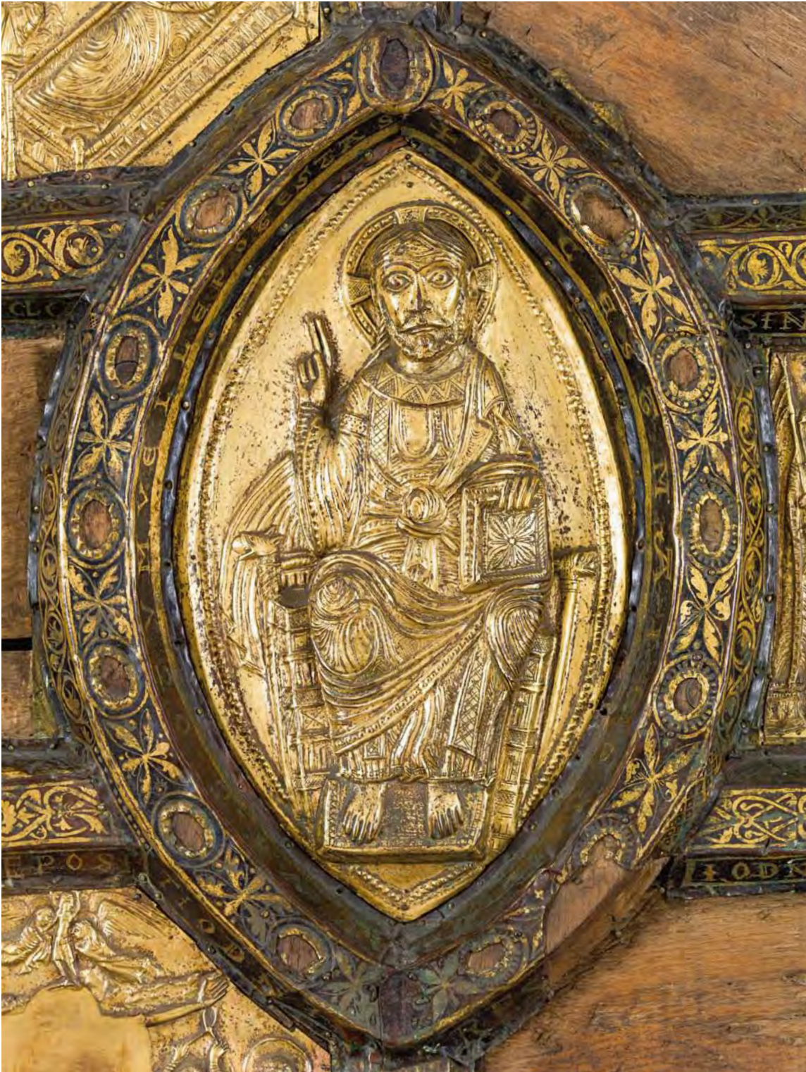
Fig. 26. Majestas Domini (relief nr. 1), udsnit af *gyldent alter fra o. 1175-1200 (s. 2142). – Majestas Domini (relief no. 1), detail of *golden altar from c. 1175-1200.