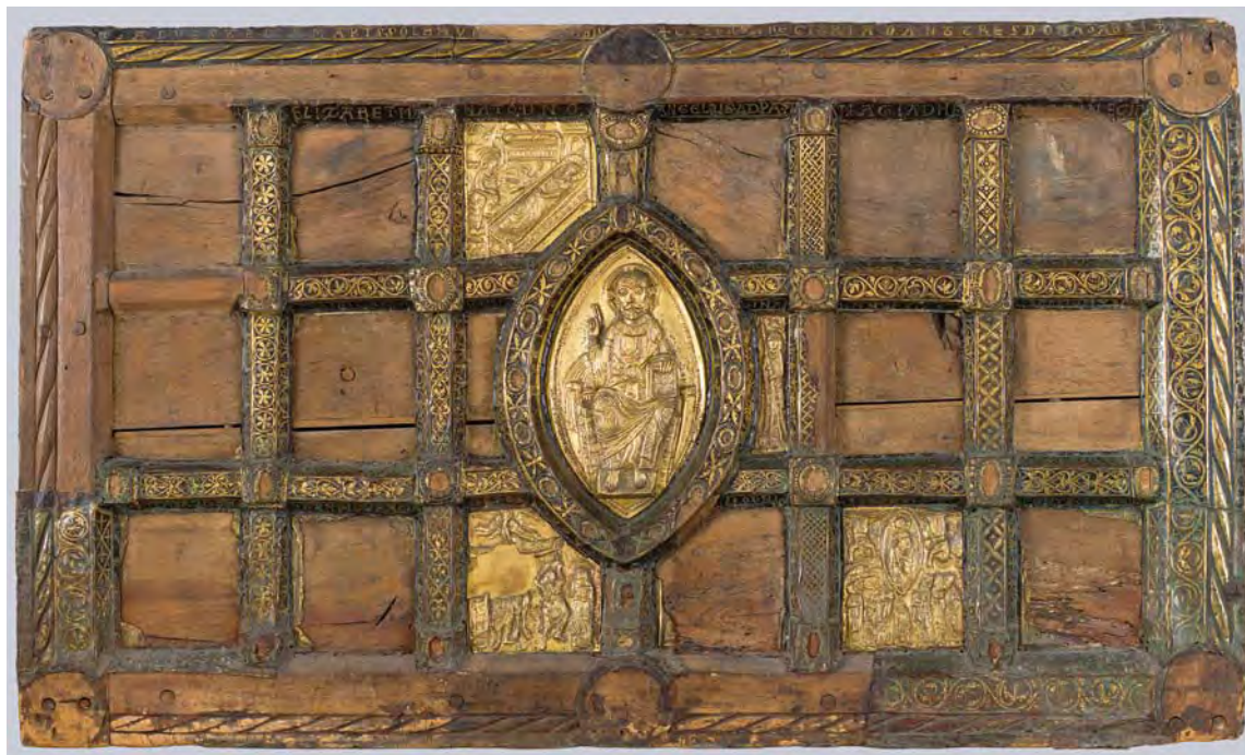
Fig. 24. ★Gyldent alter, alterbordsforside eller frontale af drevet og forgyldt kobber på træ, o. 1175–1200 (s. 2141). I Nationalmuseet. Foto Arnold Mikkelsen 2015. – ★Golden altar, Communion table frontal of chased and gilded copper on wood, c. 1175–1200.

forneden til venstre: »xptm virgo ...« (jomfruen Kristus ...). / »Salve stella maris solem vit(æ) ... rabis. Celorum regi tria dant tres dona sapei« (Hil dig havets stjerne, du skal føde livets sol. Til himlens konge giver de tre fra Saba tre gaver). / »Dvcitvr egyptvm regem fvgiens maledictvm« (Han føres til Egypten, flygtende fra den forbandede konge).