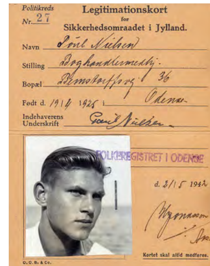
Legitimationskort udstedt 1 1/2 år før deportationen.