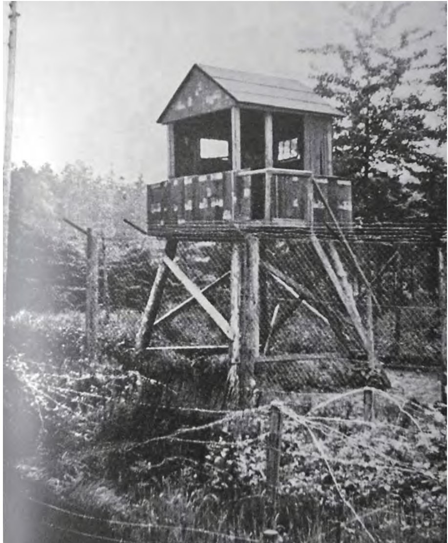
Vagttårn i Horserød, dengang.