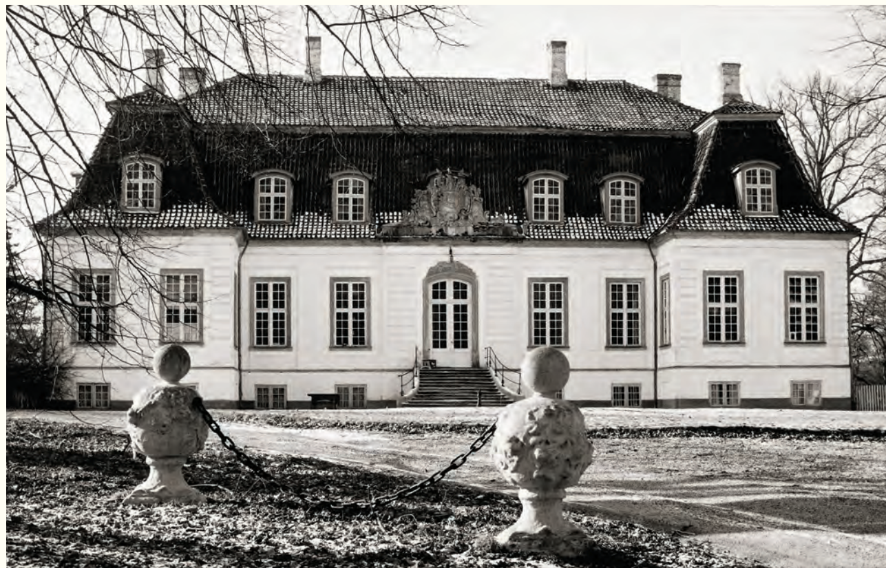
Fig. 21 Frederiksdal. Det hvidpudsede rokokolandsted har ganske små sidefløje, en midtrisalit omkring indgangen og en enkel sandstensudsmykning omkring vinduer og døre. Huset havde oprindeligt valmtag, men for at skaffe mere plads blev det i 1752-53 forsynet med et svajet mansardtag.

Forbilledet for disse landsteders bygningsform hentedes som ved de fleste barokanlæg i Frankrig. Her havde arkitekten J.-F. Blondel i 1737-38 udsendt en vejledning for opførelse af landsteder, De la disposition des maisons de plaisance . Planer heri danner forbillede for Schulins rokokolandsted med Nicolai Eigtved som arkitekt, ligesom de øver indflydelse på såvel Bernstorffs lystslot som Moltkes ombyggede landsteder, der alle havde franskmænd N.H. Jardin (1720-99) som arkitekt. Jardin opholdt sig i Danmark 1755-71, hvor han introducerede nyklassicismen og herigennem kom til at øve stor indflydelse på ikke mindst udformningen af herregårdes hovedbygninger. Han udformede desuden både interiører og haver, således fx spisesalen i Moltkes Palæ og haven ved Fredensborg Slot.