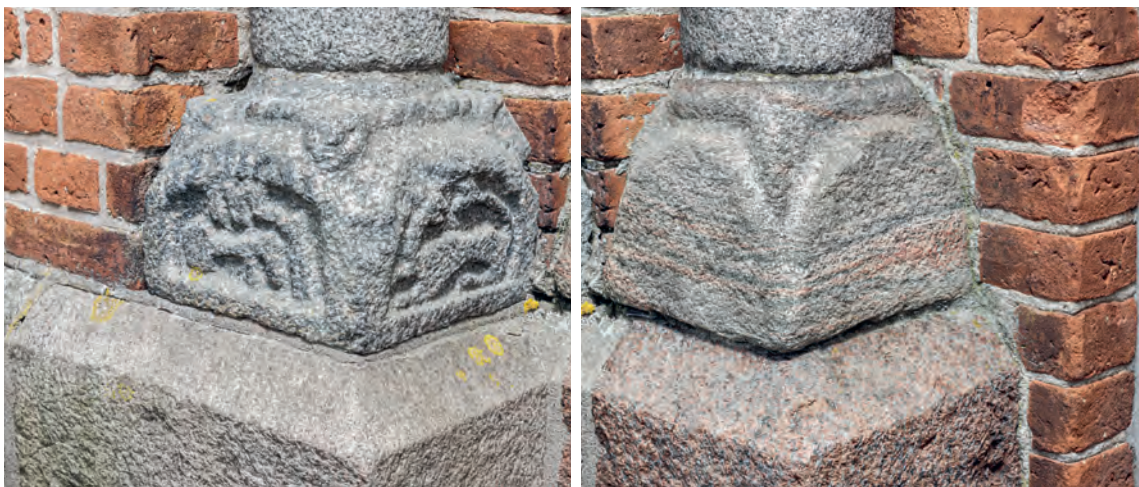
Fig. 14-15. Granitøjleportalens søjlebaser, nord. 14. Ydre søjlebase (s. 3618). 15. Indre søjlebase (s. 3618). – Column bases on portal with granite columns, north. 14. Outer column base. 15. Inner column base.

Vinduerne er rundbuede med indvendig smig og i skibet arrangeret som dobbelte åbninger i