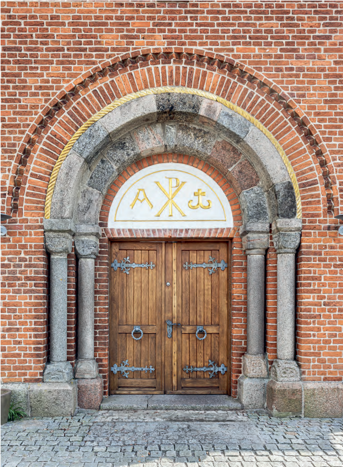
Fig. 11. Romansk granitøjleportal (s. 3617). – Romanesque portal with granite columns.