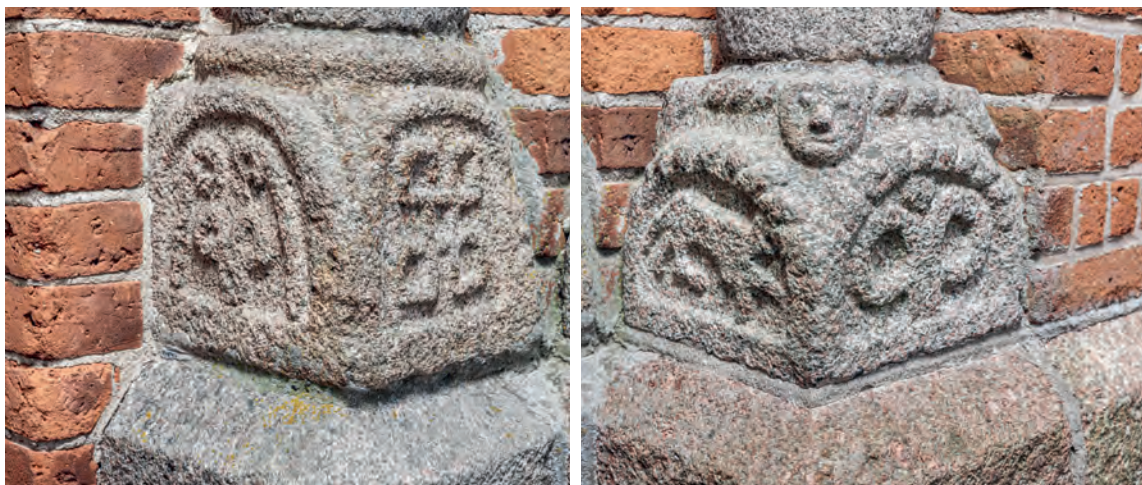
Fig. 18-19. Granitøjleportalens søjlebaser, syd. 18. Indre søjlebase (s. 3618). 19. Ydre søjlebase (s. 3618). – Column bases on portal with granite columns, south. 18. Inner column base. 19. Outer column base.

Indre. Tårnrummet fungerer som våbenhus og ydermere som fordelingsrum for trappehuset i nord og dåbsventeværelset på sydsiden (jf. ndf.). En bred dør forbinder våbenhus og skib, hvis hvidtede indre takket være de 12 høje vinduer får et gavmildt lysindfald; i kontrast hertil er ko-rets østre bagvæg derimod malet helt mørkeblå.