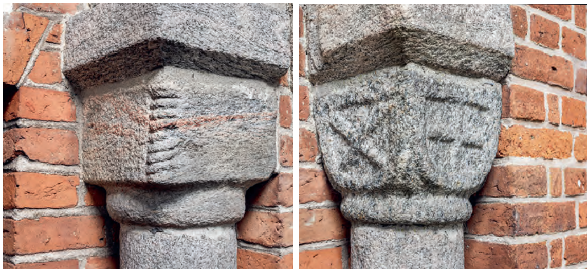
Fig. 16-17. Granitøjleportalens kapitæler, syd. 16. Indre kapital (s. 3620). 17. Ydre kapital (s. 3620). – Capitals on portal with granite columns, south. 16. Inner capital. 17. Outer capital.

hvert af langmurenes tre fag. Sålbenken, der af-dækkes af skiferplader på udkragende vederlag, er ført igennem hele blændingen, der dermed er horisontalt opdelt. Tårnets glamhuller er på samme vis koblede, men i mindre dimensioner. Vinduernes oprindelige støbejernsrammer er nu erstattet af hvidmalede aluminiumsrammer med termoruder fra 1991.