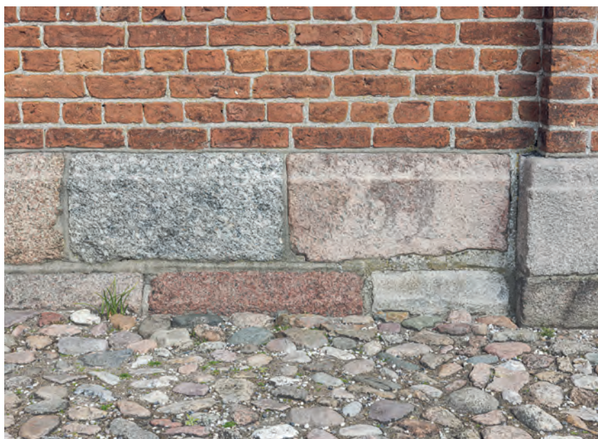
Fig. 20. Detalje af korets søndre sokkel (s. 3616). Foto Arnold Mikkelsen 2022. – Detail of southern plinth of the chancel.

Tagværket over kor og skib tæller henholdsvis seks og 17 fyrretræsfag bestående af bindbjælker og spær, der understøttes af en langstol. Drager-