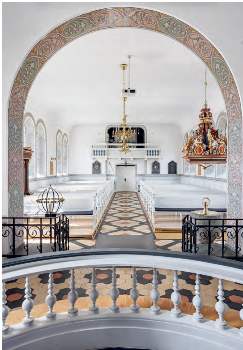
Fig. 22. Indre set mod vest. Foto Arnold Mikkelsen 2022. – Interior looking west.