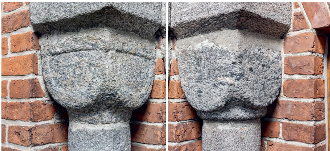
Fig. 12-13. Granitøjleportalens kapitæler, nord. 12. Ydre kapitæl (s. 3620). 13. Indre kapitæl (s. 3620). – Capitals on portal with granite columns, north. 12. Outer capital. 13. Inner capital.

uden halsring. Det indre mod syd har form som en glat kube med tovsnoet hjørne, det nordre med helt glatte skjolde.