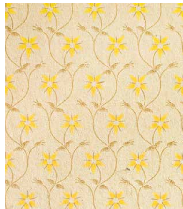
24. Ib Andersen: Tapet med blomstermønster, Ernst Dahl, sidst i 1930'erne.

Det tredje tapet er Stjernerne (fig.25), der senest blev trykt i 1938 for firmaet Ernst Dahl. 61 Mønstret havde en bred appel og blev i løbet af 1940'erne et af de mest solgte danske tapeter. 62 Det blev altså accepteret af en bred kundekreds, men også fundet værdigt til at indgå i Snedkerlaugets Møbeludstilling i 1942. 63 Allerede i 1943