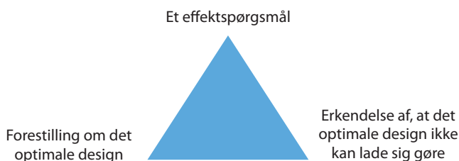
Figur 1 Evaluerings Bermudatrekant

”Det er min opgave som rådgiver at sige sandheden. 1 Et randomiseret eksperiment kræver betingelser opfyldt, som ikke er til stede her. Randomisering sker per definition prospektivt, altså før indsatsen sættes i værk. Det er under alle omstændigheder for sent nu. Lad os enes om det faktum, at man ikke kan spole tiden tilbage. Vi er en situation, som når svigermor klager over, at hun skulle være blevet kunstmaler. Ja, svigermor, men du havde ikke talentet, og du kan ikke omgøre de valg, du traf i ungdommen. Men hvis du vender klage til fremadrettet handling, så kan du måske hygge dig med et malekursus i AOF”.